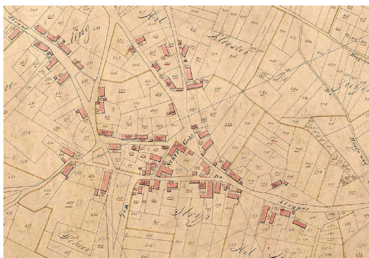
Een plattegrond van Leenderstrijp