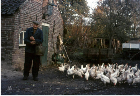
Ook in Leende was een melkfabriek en een Eiermijn. Met later een centrale diepvries.