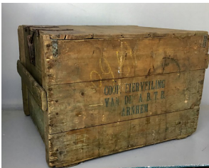
Eierkist. Hierin zaten 5 rekjes van 10 x 10 eieren. De eieren werden opgehaald. O.a. door Thomas van der Laak.