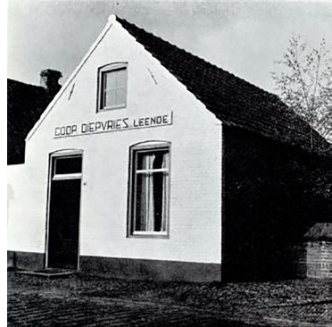
De melkfabriek Leende ging samen met Leenderstrijp. Later werd het gefuseerd met de melkfabriek in Heeze. De melk ging met de romkar van Leenderstrijp via Leende naar Heeze. Dit gebouw werd later omgebouwd tot bruin café. De naam: Het Kruikske.