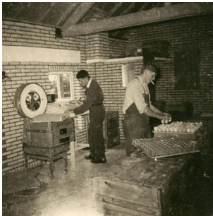
De eieren worden gesorteerd.