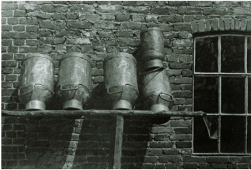
De melk werd vervoerd in schone melkbussen van 30 liter. In de volmond kruiken.